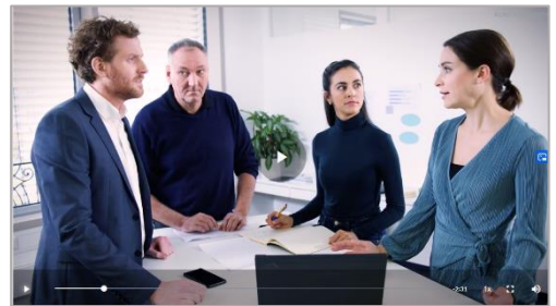
Schlechte Stimmung im Team: Mit richtigem Feedback geht's besser.