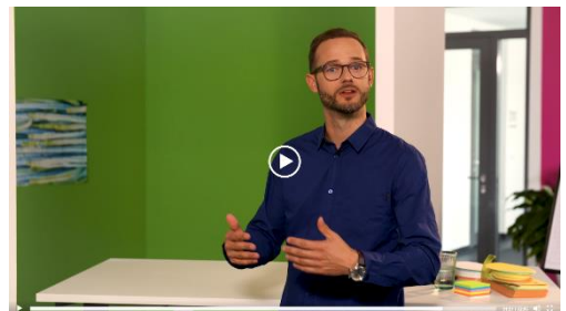
Der Moderator erklärt ein Werkzeug wertschätzender Kommunikation: Gemeinsamkeiten betonen.