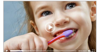
Zähneputzen als Bsp. für erfolgreiches Design Thinking.