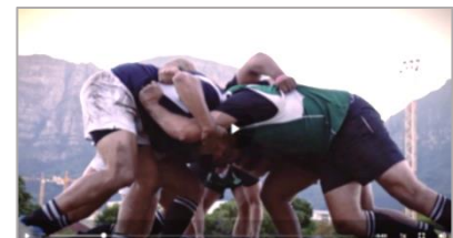
Scrum heißt im Rugby „Gedränge.“