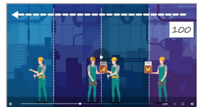
Mit Kanban kommt die Arbeit in einen Flow.